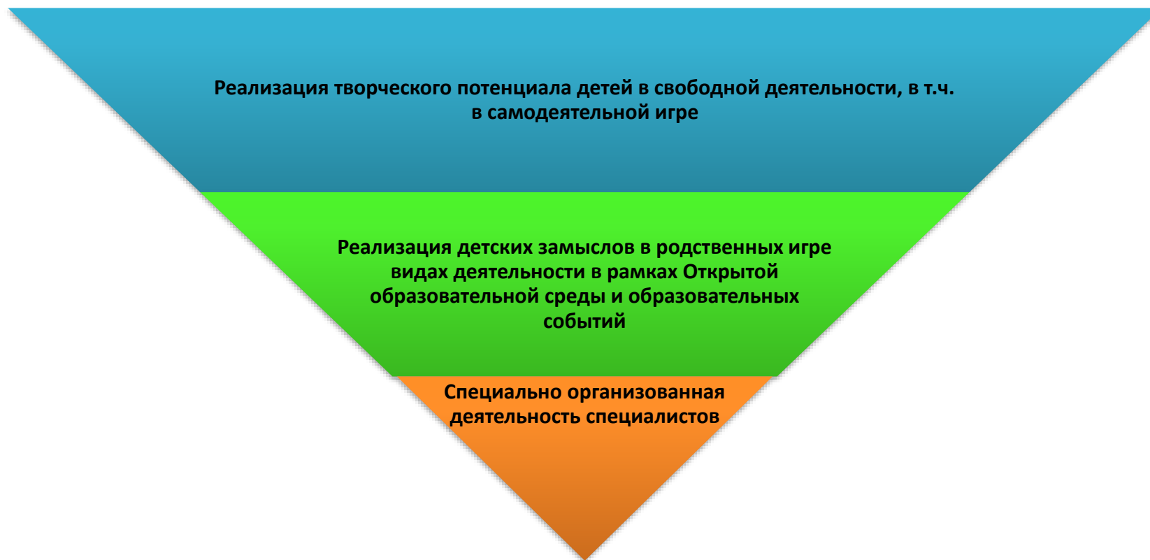
Схема 5. Методы реализации содержания ОО «Художественно-эстетическое развитие»