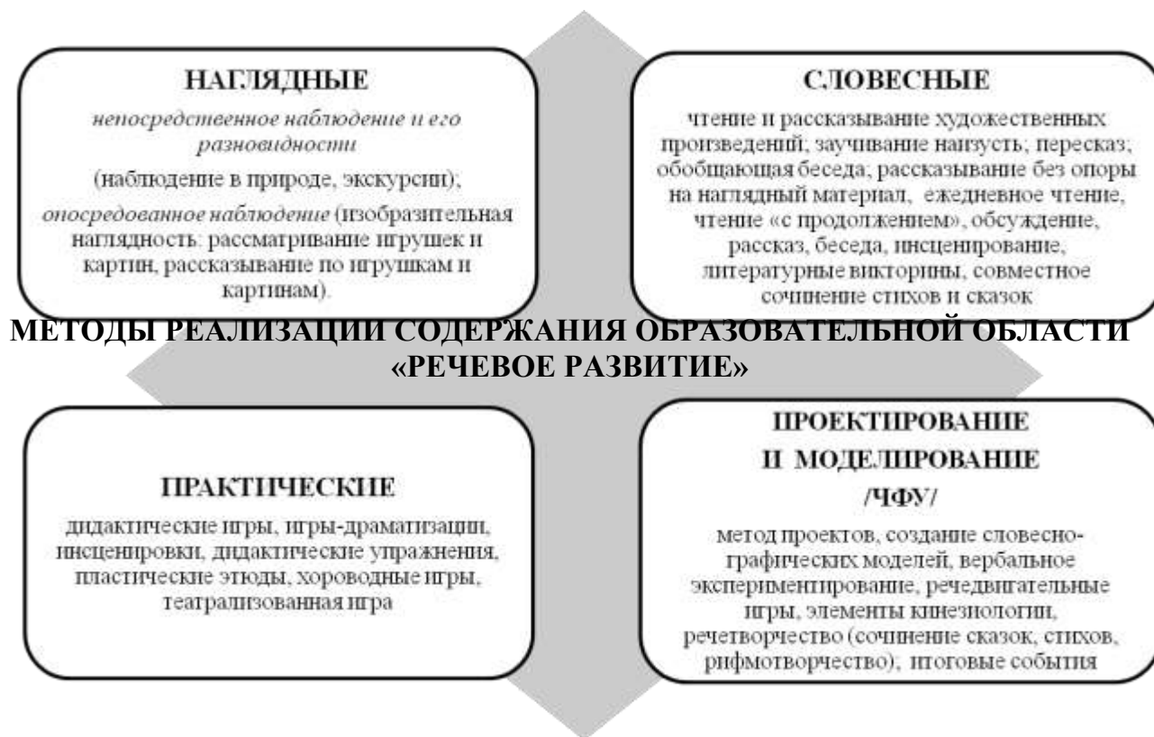
Схема 4. Методы реализации содержания ОО «Речевое развитие»