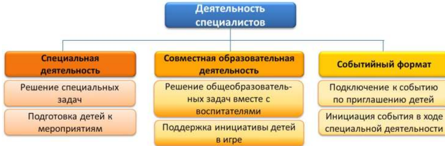
Схема 7. Матрица возможностей включения специалистов в свободную деятельность детей

Матрица возможностей включения специалистов в свободную деятельность детей в рамках инновационной деятельности детского сада представлена ниже на Схеме 7.